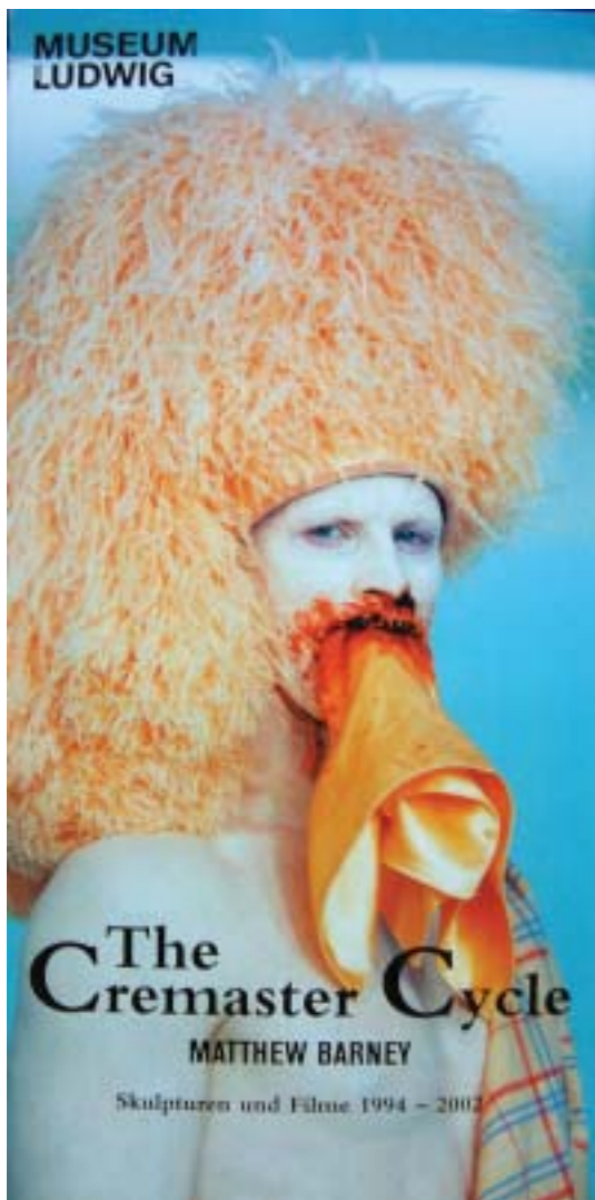
● 巴尼首次Cremaster系列展覽於路德維希美術館。路德維希美術館 / 提供

之後在一九九三年的惠特尼雙年展，在他的“Drawing Restraint 7”作品中，巴尼則扮演了一個沒毛、有羊腿、無生殖器的森林之神(satyr)，這個喜縱樂淫亂的森林之神還有著像臘腸似的尾巴以及笨拙的雙腿。在一九九四年四月到十一月製作的【睪丸薄懸肌系列】首作【睪丸薄懸肌之四】(Cremaster 4)，更開啓了巴尼讓世人更驚艷的藝術之作，這個四十三分鐘的影像作品，主要發生在位於英格蘭與愛爾蘭間的一個海上島嶼—曼島(Isle of Man)上，演出者有八個演員和一隻曼島的特殊朗頓羊種(Loughton sheep)，而巴尼自己則擔任主角。