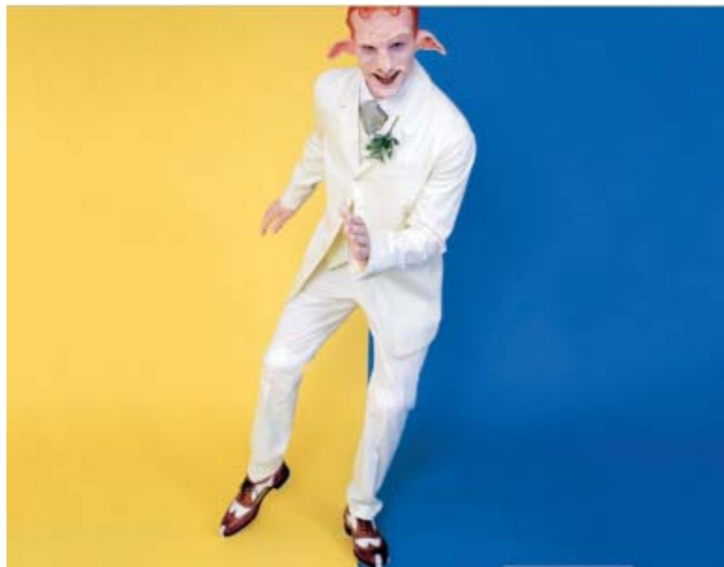
● 巴尼所扮演的朗頓候選人。

【睪丸薄懸肌之四】作品裡巴尼是一個混種，有著拉長的耳朵的半羊半人角色，另外三個雌雄同體的精靈(faerie)，有著如女子健美選手的體格。faerie在古法語裡指的是年幼的超自然生命體，如果