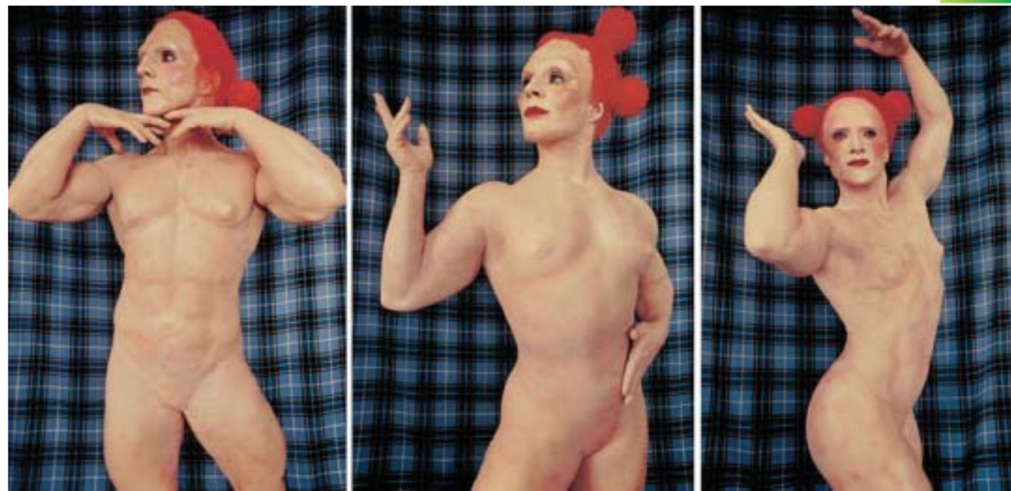
● 由左至右分別是下垂精靈、朗頓精靈、以及上揚精靈。圖片引用自http://www.cremaster.net。

把faerie連結到拉丁字的fatum，意指的是fate或是destiny，就是命運或是命運三女神的意思。在【睪丸薄懸肌之四】裡扮演三個女子健美精靈，體態是被