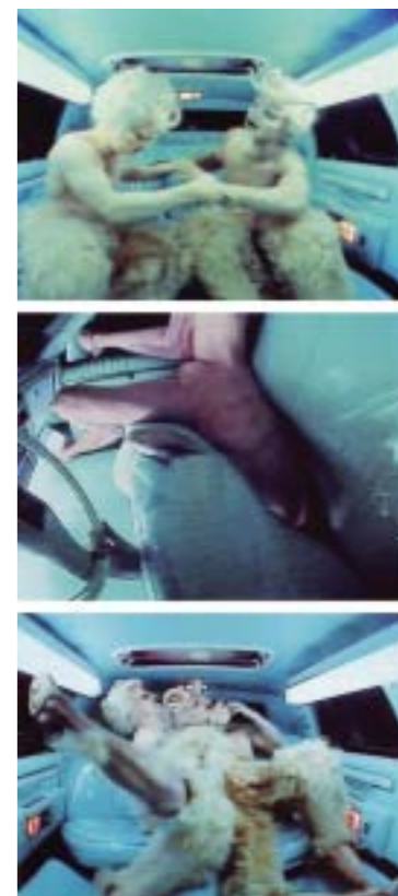
● Drawing Restraint 7作品中的影像。圖片引用自 http://danm.ucsc.edu/web/MatthewBarneyReport 。

畫廊現場在不同的四個地點，還展示著不同的影像，其中有一個影片是巴尼裸身並利用人造的裝置隱藏他的生殖器，扮演著成為巴尼藝術重要推手的Harry Houdini，影片裡他正用拳猛擊著另一位扮演傳奇性足球員Jim Otto演員的太陽神經叢，而另一部播放器則播放名為【看不見的會陰】(Blind Perineum) 4 的八十四分鐘影片。很明顯的，強烈的性別傾向反映在巴尼的創作上。