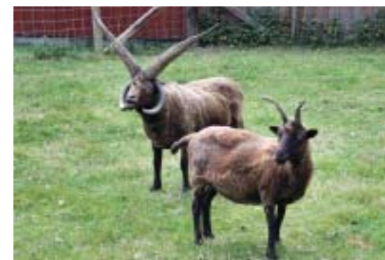
● 朗頓羊，前者為母羊，後者為公羊。

這三個健美女子精靈幾乎是無毛的生物，她們的外生殖器用假體及化妝技術將之掩蓋起來，而頭上的紅髮像中國的假髻一般的梳妝，而最有女人味的一個稱之為上揚精靈(Ascending Faerie)，她的頭頂著如卵巢般上升的假髻、而下垂精靈(Descending Faerie)的假髻則有著如下垂的睪丸，而朗頓精靈(Loughton Faerie)則是如同朗頓羊種一般有著惱人的兩個上揚和兩個下垂的紅髮假髻。她們處處在影片中呈現獨特的